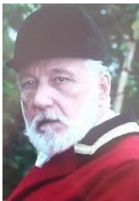
Le comte de la Fresnaye